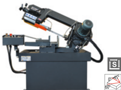
BMSY 230 DG