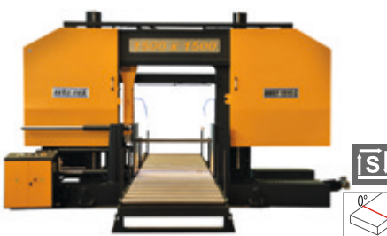
BMSY 1515 C