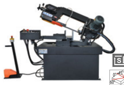
BMSY 230 DGH