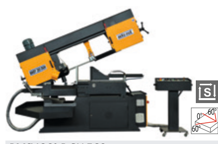
BMSY 360 DGH ECO