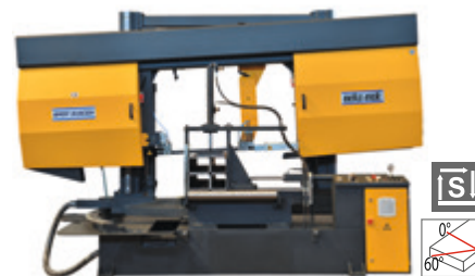
BMSY 810 CGH