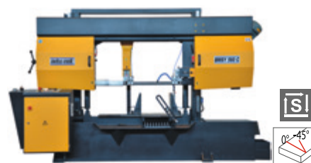
BMSY 560 C