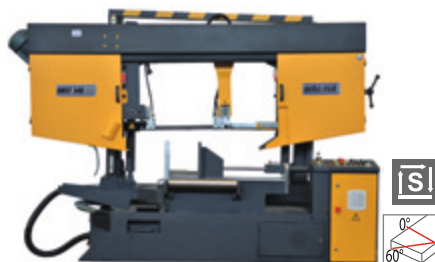
BMSY 540 CGH