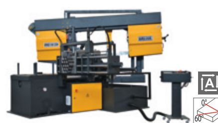
BMSO 540 CGH NC