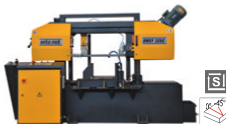
BMSY 325 C