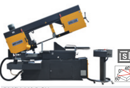
BMSY 440 DGH