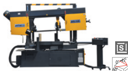
BMSY 440 CDGH