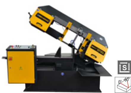
BMSY 320 GL