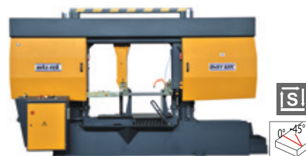
BMSY 820 C