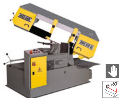
BMS 320 GL