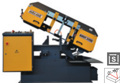
BMSY 320 G