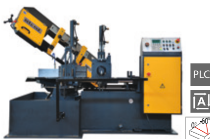
BMSO 320 GH NC