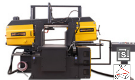
BMSO 440 CGS NC