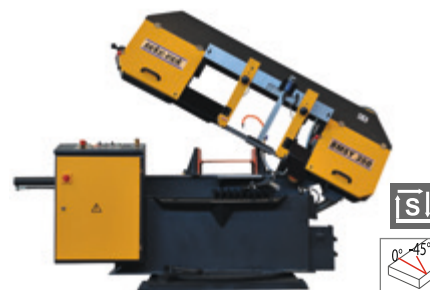
BMSY 350 M