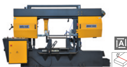
BMSO 560 C