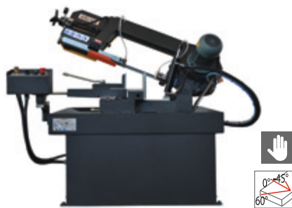
BMS 230 DG