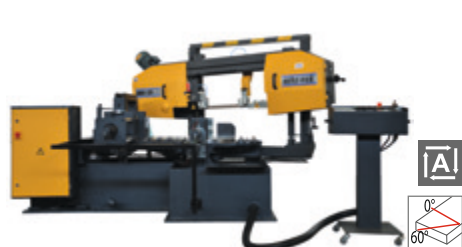
BMSO 325 CGH NC